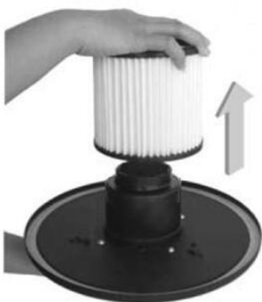
Obrázek: Vyjmutí a nasazení filtru

V případě, že je filtr plný prachu, může dojít ke zhoršení výkonu vysavače. Ujistěte se, že je vysavač vypnutý a napájecí kabel je vytáhnutý ze zásuvky. Vyjměte filtr a důkladně ho vyčistěte. Součástí balení je papírový filtr. K zařízení je možné dokoupit náhradní papírový filtr (typ 650137). Papírový ani látkový filtr nikdy nečistěte ostrým předmětem. Jakmile filtr vyčistíte, zkontrolujte, jestli je ještě vhodný k dalšímu použití. V případě, že filtr není poškozený, prasklý, nebo příliš opotřebovaný, nasadte filtr zpět přesně do původní polohy. Pokud je filtr poškozený, prasklý, nebo příliš opotřebovaný, vyměňte jej za nový originální filtr.